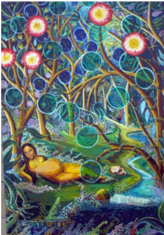
Mi Soledad Óleo sobre tela. 121 x 84,5 cm. 1998.