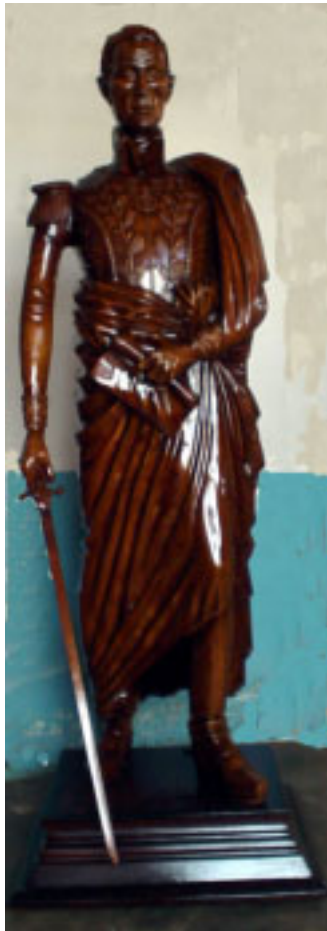
Bolívar Talla en madera de cedro 2 m. de altura. 2002.

Vive actualmente con su esposa en la Calle Concepción N°. 36 en Güiria. Municipio Valdez. El curso de carpintería que realizara en el INCE, le enseñó el uso de las herramientas y la selección de las maderas. Paralelamente a la carpintería trabaja la escultura.