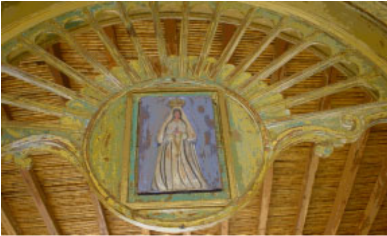
Virgen del Valle.

Relieve; talla en madera de cedro policromada.