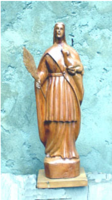
La Virgen Santa Inés. Talle en madera de cedro. Altura 2002. Colección particular

Vive en la Calle Pichincha con calle Ayacucho y trabaja en su taller ubicado en la Carretera Vieja, Barrio San Baltasar. Nos recibe en un gran espacio lleno de troncos de cedro; habla de su obra, de la oferta y la demanda y el proyecto de realizar en el futuro un museo de dos plantas, allí mismo en su taller. Comienza a trabajar como escultor desde 1985 y desde el año '86 participa en Exposiciones colectivas e individuales, Salones y Bienales a nivel regional y nacional. Su obra ha sido distinguida con los siguientes premios: Premio Talla Popular. II Salón Cervecería de Oriente. Barcelona. Mención Honorífica. II Salón de Artes Visuales Guardia Nacional. Cumaná. Condecoración en su 3ra. Clase Orden Gran Mariscal de Ayacucho. Cumaná. Honor al Mérito, Día del artista plástico. Escuela de Artes Plásticas. Cumaná. Ediciones 2001 - 2002.