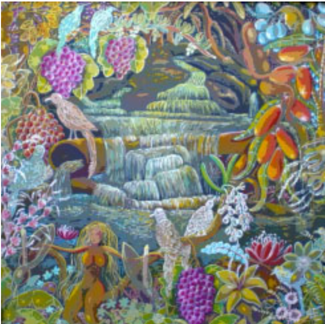
Poesía en un manantial.

Nace en Cariaquito, Municipio Andrés Mata el 15 de Abril del año 1953, donde habita desde entonces dentro de su ambiente familiar. Cultiva la tierra y vende sus productos en el mercado. Paralelamente a su actividad plástica se desempeña como promotor cultural, trabajo que realiza con mucha vocación, con liderazgo natural, logrando integrar y dar a conocer a un grupo de artistas de la región. Participa con regularidad en los Salones y Bienales más importantes del país, donde la crítica especializada le a otorgado más de 26 premios, entre ellos: Bárbaro Rivas en Caracas, Salón Regional de Oriente, Salón Nacional Artes de Aragua, XVI Salón de Arte LAGOVEN, Salvador Valero en Trujillo, XX Salón Municipal de Pintura Alcaldía de Girardot del Estado Aragua.