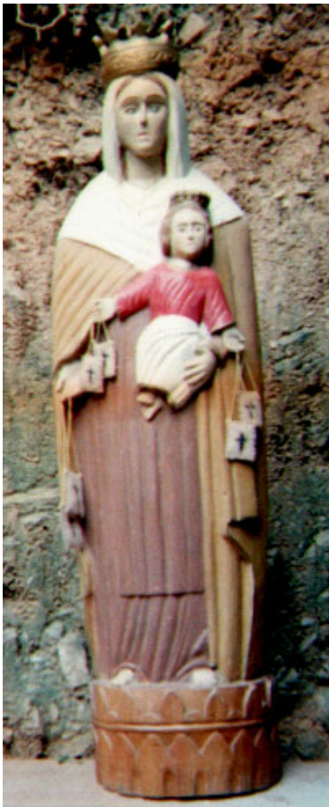
Virgen del Carmen