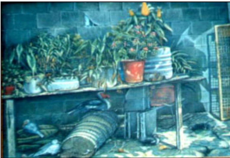
Jardín con patos.

Vive en la calle Principal del sector La Frontera en Güiria, Municipio Valdez. En su quehacer diario comparte el tiempo con su familia, la pintura, la construcción de su casa y la siembra en su traspatio. Empezó a pintar a los veinte años "...En 1987 me salí de los paisajes y comencé a trabajar los mínimos detalles de los patios de nuestras casas, con sus animales, sus peroles, esos rincones íntimos que delatan la belleza del jardín, la pobreza del fondo o patio de la casa." Ha expuesto en Caracas, La Guaira, Mérida y en algunos Salones Regionales.