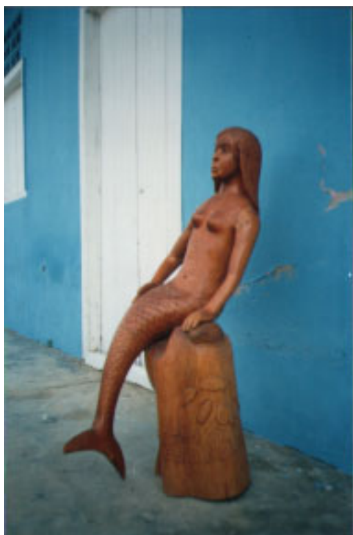
Sirena. Talla en madera de cedro. 112 cm. de Altura 2001.-