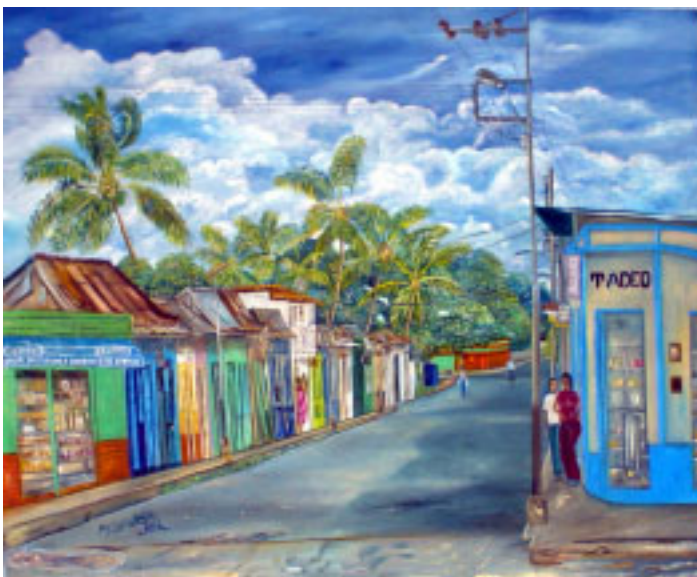
Calle Bolívar de Güiria.

Ha recibido clases de dibujo y pintura en su localidad y en Caracas. Uno de sus proyectos personales es pintar las plazas dedicadas a Bolívar de las principales ciudades y pueblos de Venezuela. Veinte años de actividad, lo conducen a exponer en compañía de amigos a todo lo largo y ancho de nuestro territorio: Güiria, Mérida, La Güaira, Guayana, San Félix y en la Universidad Central de Venezuela. En 1998 la Alcaldía de Güiria reconoce su labor otorgándole EL BOTON AL MERITO.