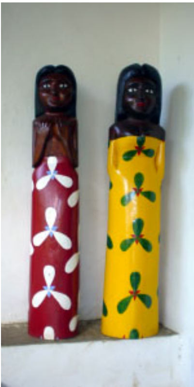
Las negritas de la Toma.

Desde el año 1987, a los 23 años de edad, empezó a tallar la madera. Su obra es reconocida por la comunidad, constantemente vende lo que hace. La crítica especializada le ha otorgado: Premio Mención Talla, 1º Salón Nacional Cervecería de Oriente. 1988. Premio a la Obra de Arte Ingenuo, III Bienal de Artes de Oriente. 1990, II Salón de la Cervecería de Oriente. 1993.